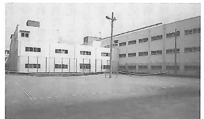
渡り廊下が完成し、テニスコートが2面できました。