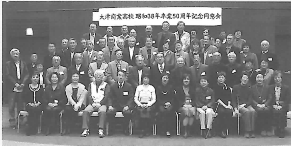
大津商業高校 昭和38年卒業50周年記念同窓会