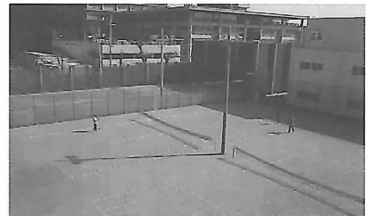
手前2面が、クレイコート。奥にあるのが先にできていたオムニコートです。