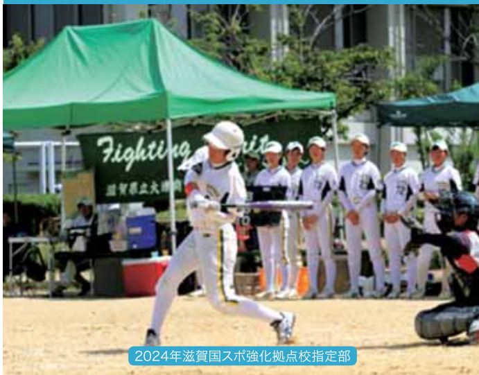
ソフトボール(女子)