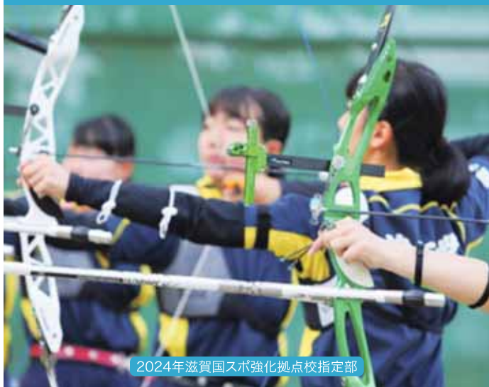
アーチェリー(男子・女子)