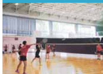
バドミントン(女子)