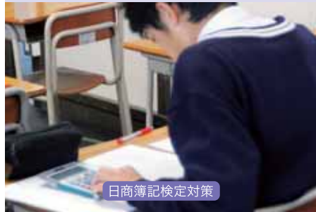
日商簿記検定対策

会計情報をビジネスの諸活動に活用できる人材を育成します。 「簿記」「財務会計」「原価計算」「管理会計」「財務会計」など、企業の会計に関する専門科目を学び、新時代に適応する知識や技術の習得を目指します。