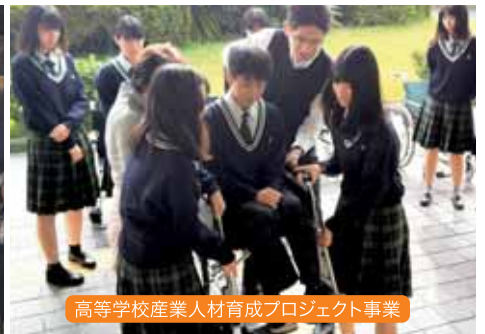
高等学校産業人材育成プロジェクト事業