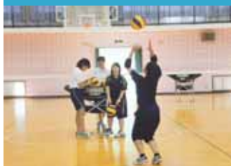
バレーボール(女子)