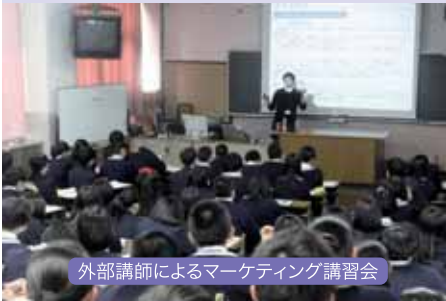
外部講師によるマーケティング講習会

多様なビジネスに柔軟な対応ができる人材を育成します。 「マーケティング」「商品開発」「広告と販売促進」など、経済の流通分野を中心に生産から消費まで幅広く学習し、プレゼンテーション能力等の育成を図ります。