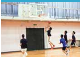
バスケットボール(男子)