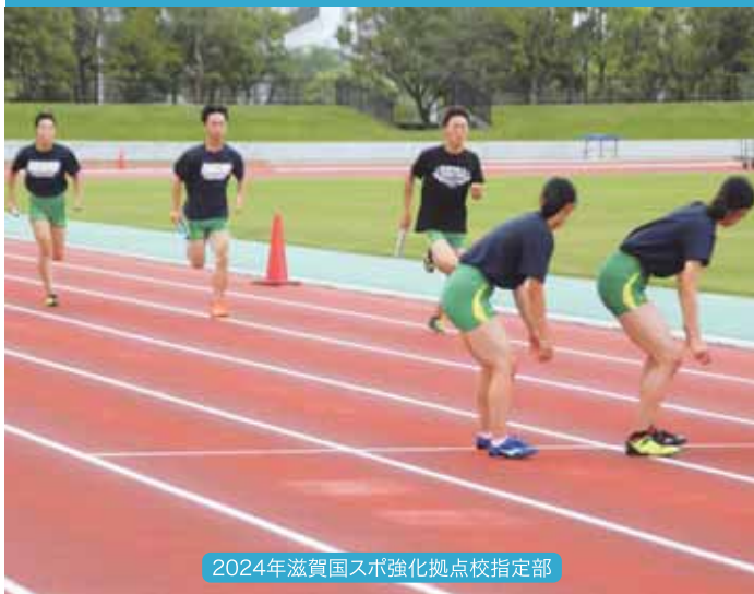
陸上競技(男子・女子)