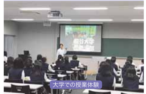
大学での授業体験

社会の国際化に幅広く対応できる人材を育成します。 「ビジネス経済」「経済活動と法」「コミュニケーション英語」などを中心に学び、国際ビジネスに対応するための語学力とともに、ビジネスの諸活動に関する知識と技術の習得を目指します。