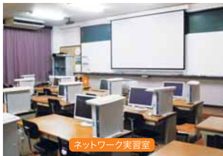
ネットワーク実習室

プログラミング実習室は、第1プログラミング実習室から第5プログラミング実習室まであり、コンピュータは250台以上あります。ネットワーク実習室、情報総合実践室は、「情報処理」「プログラミング」「総合実践」「電子商取引」などの授業で使用します。視聴覚機器を設置した商品実験室は一度に98人収容出来ます。