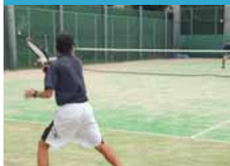
ソフトテニス(男子)