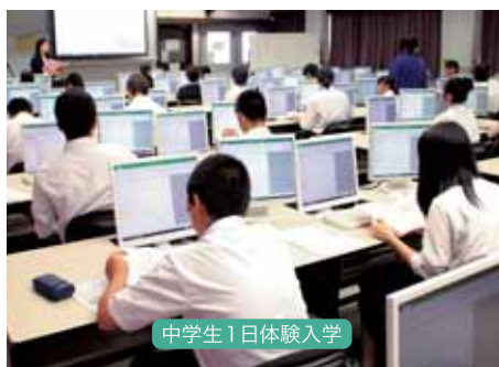
中学生1日体験入学