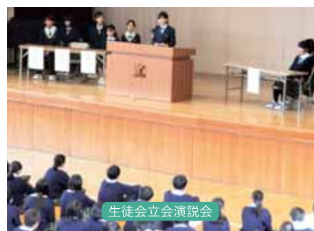
生徒会立会演説会