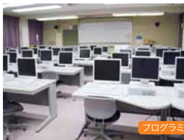
プログラミング実習室