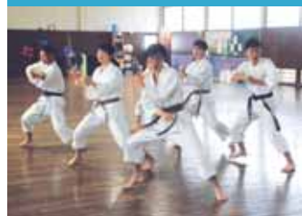
スポーツ拳法(男子・女子)