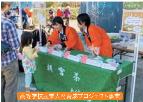
高等学校産業人材育成プロジェクト事業